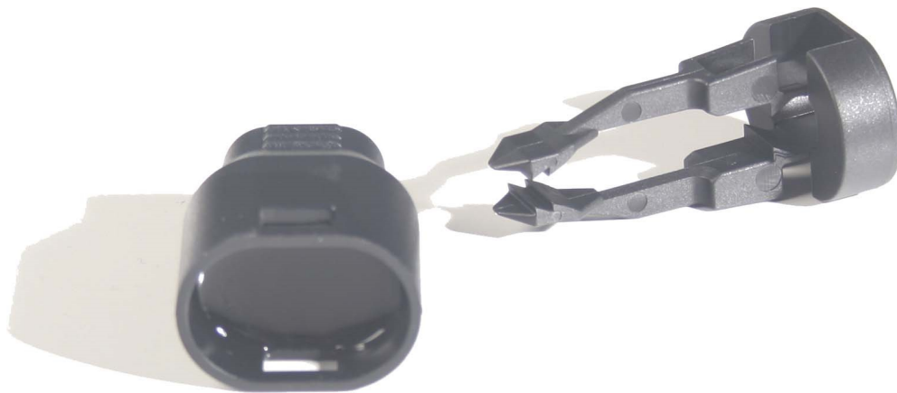
DOMOCLICK DHB-400 TERMINAISON DE RUBAN CHAUFFANT